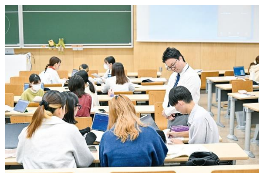
（世界市民教育の充実を図る）

また、本プログラムの実効性を高めるため、正課（授業）内外の学生生活全体を通じた「価値創造教育プログラム」の概念整理および体系化を進め、プログラム遂行を担う教職員の職能開発の取り組みの検討を開始した。