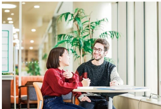
（グローバル化を推進）

特に外国人留学生については、グランドデザインとして 2030 年までに、1 学年 200 人（学部生）を受け入れることを目標としている。本年度も海外での入試説明会の実施、発展著しい地域の高校との連携による推薦入学制度、海外からの編入学などを進め、外国人留学生の段階的な増加に取り組んだ。また学生の海外派遣については、「国際協働オンライン学習プログラム（COIL）」も活用したほか、文部科学省「大学の国際化促進フォーラム」におけるプロジェクト「国際交流プログラムの効果の客観的評価テスト開発及びその普及」における成果分析ツール「BEVI」の拠点として、海外派遣学生の研修前後の成果を測定し、海外留学・研修の充実に努めた。