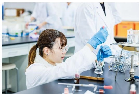
（若手研究者支援の取り組みを推進）

研究活動における不正行為を防止すべく、本学において研究活動に従事する者に対し、研究倫理教育eラーニング教材「eAPRIN」の受講を促し、定期的な受講確認を行った。さらに、博士前期課程ならびに修士課程の全大学院生（専門職大学院を除く）に対する必修科目「研究倫理 (Research Ethics)」の提供や、外部講師による講演会の開催等を通じ、学内における研究倫理に関する規範意識の醸成を促した。同時に、受講対象者へのコンプライアンス教育の実施を推進するとともに、研究費不正使用防止に関する啓発活動に取り組んだ。