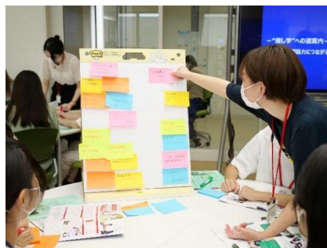
(高校生向けのSDGsイベントを開催)

第3回 SDGs グッドプラクティスの募集において、SDGs達成に資する実現可能性の高いアイデア4件を採択し、その実現を支援した。SDGs目標達成に貢献する人材の育成では、「持続可能な町づくり」をテーマに開催された第5回 SDGs・対話ネットワーキング会合に、昨年度に続いて高大連携協定校から高校生と教員が参加した。その他、SDGsに関係する人的ネットワークの拡大への取り組みとともに、外交や国際協力分野での活躍を目指す学生の支援強化を目的とするセンター開設に向けた準備を進めた。