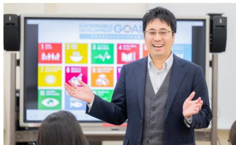
（SDGs 推進など教育内容を充実）

充実を図ってきた英語特別プログラム（E-Swans）、ビジネス特設クラスに加え、開設2年目となる「ホテル・航空業界特設クラス」では、それぞれの特徴を生かし、ホテルや航空業界に必要な専門的知識、マナーやサービス実務能力の修得を目指す科目、業界に特化したホスピタリティ&サービス英語科目を実施した。さらに志望する進路就職が勝ち取れるように教職員がサポートした。また昨年に引き続き、都内にある日本屈指の高級ホテルで実践的な経験を積むインターンシップを実施し単位認定を行った。その他、「輝く女性育成」と「SDGs」の二つの推進については、課外でのセミナーやワークショップなどを実施した。